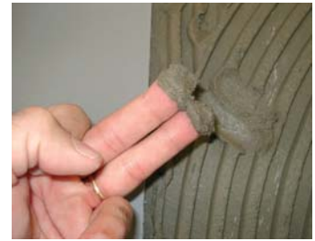
Comprovar que el ciment estigui fresc.