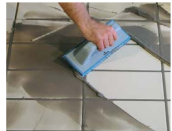
Rejuntar passades 4 hores de la col.locació.