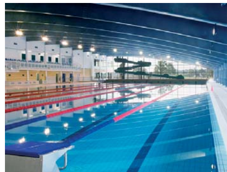
Ideal per enganxar ceràmica en piscines.