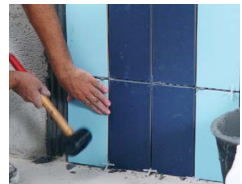
Usar una maça de goma.