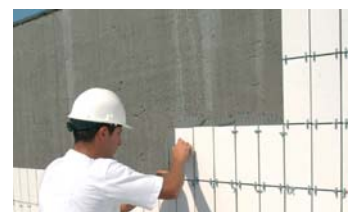
Fixació sobre de la impermeabilització.