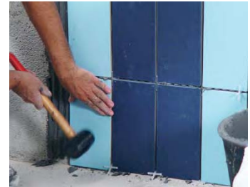
Usar una maça de goma.