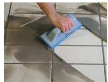
Rejuntar passades 4 hores de la col·locació.