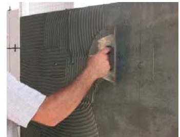
Usar la tècnica del doble encolat.