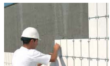
Fixació sobre de l' HIDROELASTIC .