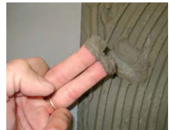
Comprovar que el ciment estigui fresc.