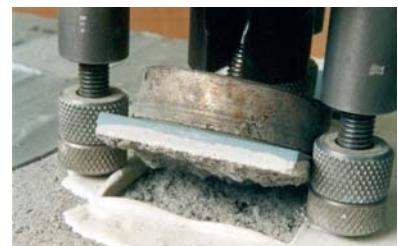
TECNOCOL FLEX és un ciment cola de màxima adhesió.