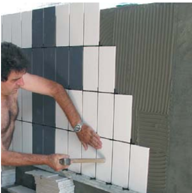
TECNOCOL FLEX és ideal per enganxar gres a sobre de la impermeabilització d' HIDROELASTIC en piscines.