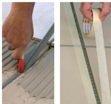
Embutir previamente SELLALASTIC FOAM ; proteger los lados de la junta de dilatación con cinta de pintor.

Se puede pintar la junta sólo cuando ya ha secado por completo. Son recomendables las pinturas en dispersión acrílica o vinílica, o esmaltes, siempre con previo ensayo.