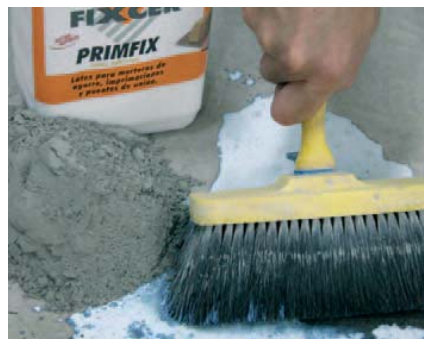
Lechada de agarre: PRIMFIX + portland puro.