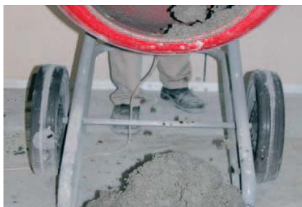
Mortero con aspecto de "arena mojada"