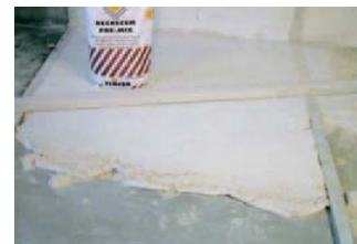
Soleras de calidad homogénea.