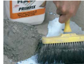
Verter directamente sobre la lechada.