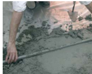
Usar las herramientas de siempre.