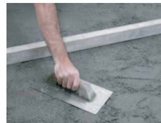
Si es preciso, también podemos alisarlo.