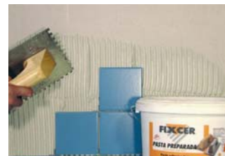
Usar eines adequades.