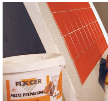
PASTA PREPARADA és molt flexible.