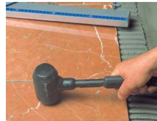
Usar una maça de goma.