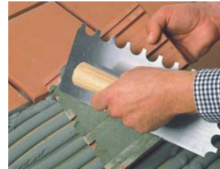
Usar la tècnica del doble encolat.