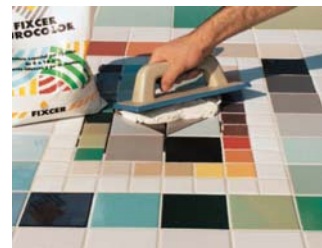
Un bon rejuntat és essencial.