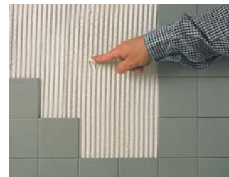
Comprovar que l'adhesiu estigui fresc.