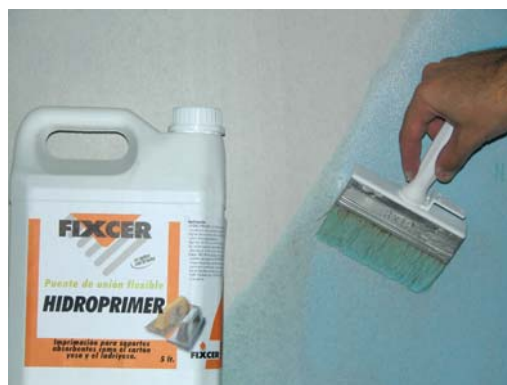
Imprimación con HIDROPRIMER .