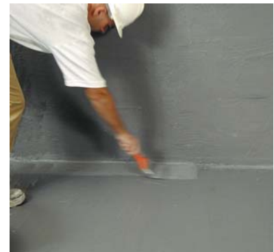
Aplicació de la 2ª mà d' HIDROFIX .