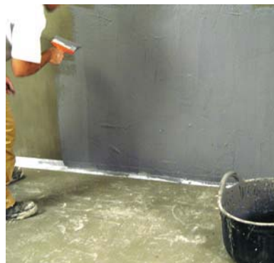
Aplicació de la 1ª mà d' HIDROFIX .