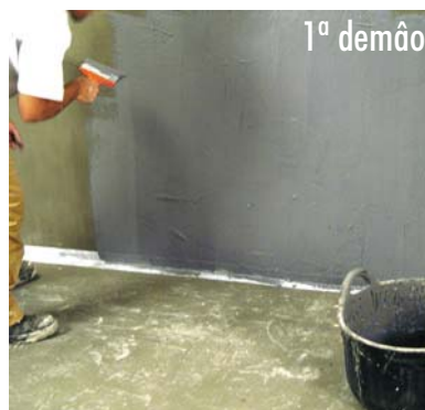
Aplicação da 1ª demão de HIDROELASTIC .