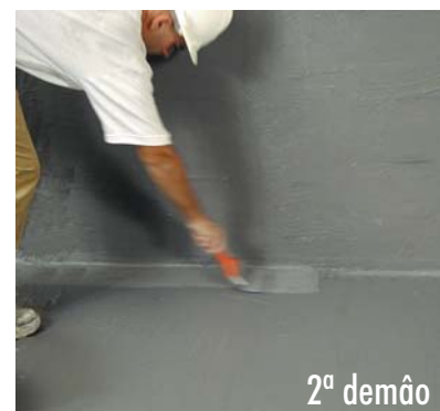
Aplicação da 2ª demão de HIDROELASTIC .