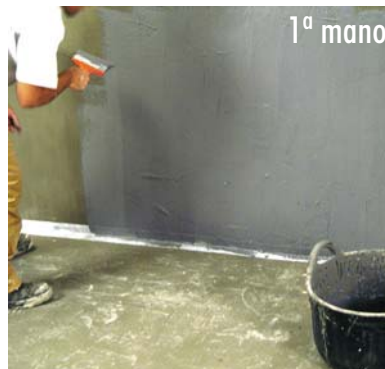
Aplicación de la 1ª mano de HIDROELASTIC .