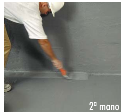
Aplicación de la 2ª mano de HIDROELASTIC .