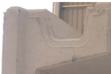
Idéal pour les pièces de type Sistema S10 de Rosa Gres.