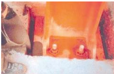
Verser rapidement et en continu.

Si le coulis est utilisé avec des plaques d'ancrage, la distance entre le béton et la plaque doit toujours être supérieure à 3 cm et inférieure à 8 cm. Si une épaisseur supérieure est nécessaire, effectuer l'application en deux couches en attendant 24 heures entre la 1 ère couche et la suivante.