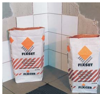
Sans FIXSET, apte pour les sols et revêtements.