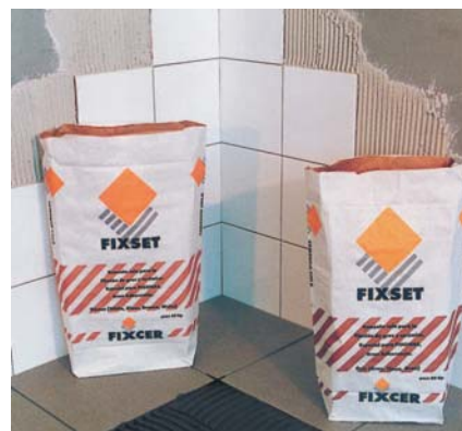
FIXSET: apte per paviments i revestiments.