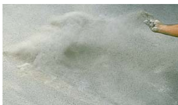
Cemento aplicable por ESPOLVOREO .