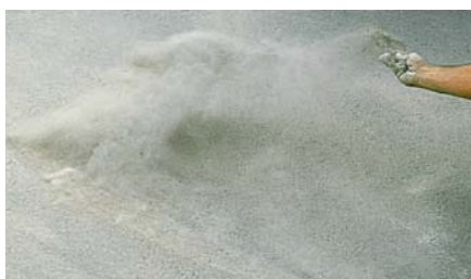
Ciment aplicable per ESPOLVOREIG .