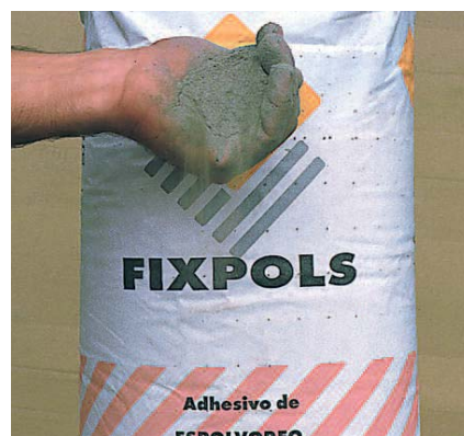
FIXPOLS està disponible en sacs de 25 Kgs.