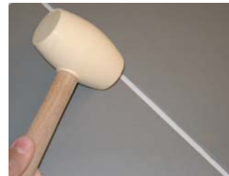
Usar una maça de goma.