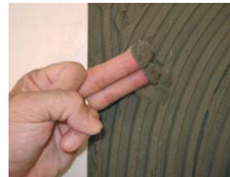
Comprovar que el ciment estigui fresc.