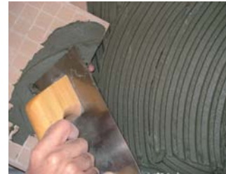
Usar la tècnica del doble encolat.