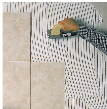
Ideal per enganxar rajols sobre cartró-guix.