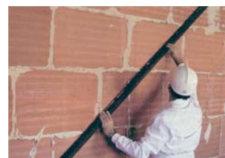
Ideal per enganxar rajols sobre super-tabics.