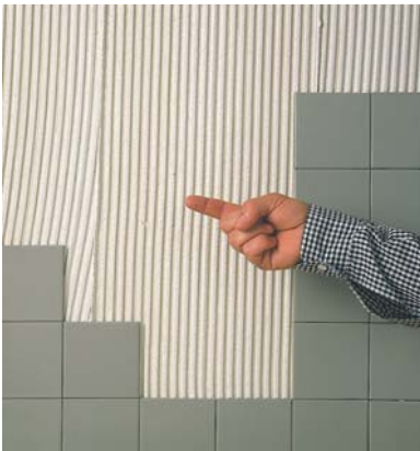
Ciment sec: no és correcte.