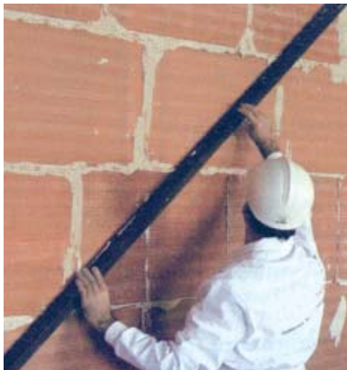
Colocación sobre super-tabique.

Recomendamos usar un material específico como el FIXCOLOR (grano fino o grueso) o EUROCOLOR FLEX o el EUROCOLOR FLEX PLUS o el JUNTA-TEC o el CERPOXI . En las juntas de dilatación aplicaremos un material específico y elástico como el SELLALASTIC .