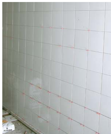
Colocación de azulejos sobre revoques de yeso.

FIXPLACA YESO es un cemento-cola formulado a base de cemento, áridos seleccionados y aditivos específicos que, amasados con agua, dan un cemento de fácil trabajabilidad con la llana dentada, y permite el pegado seguro de cualquier tipo de azulejo sobre yeso o paneles de yeso.