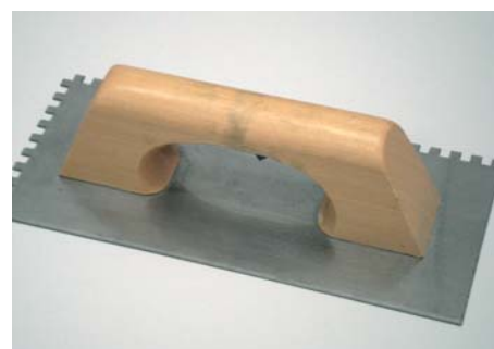
Utilizzare la parte sottile della cazzuola in metallo.