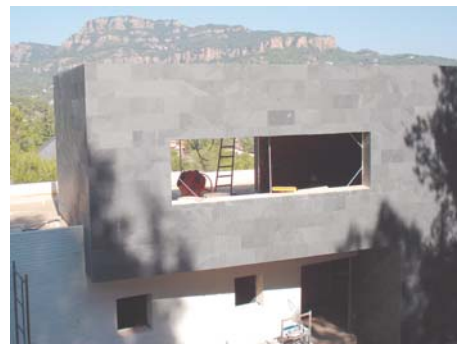
Ideal per FAÇANES exteriors: és molt flexible.