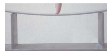
Màxima flexibilitat: qualitat S2 .