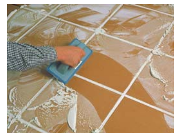
Rejuntar passades 24 hores de la col.locació.