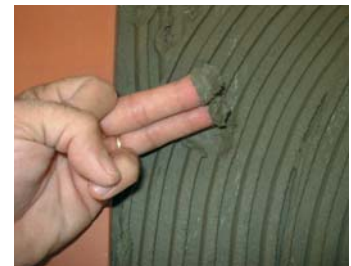
Comprovar que el ciment estigui fresc.