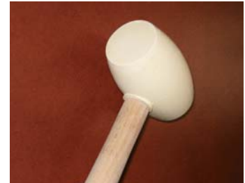
Usar una maça de goma.