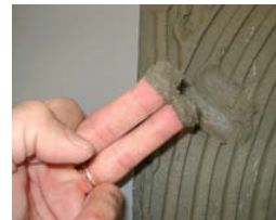
Vérifier que le ciment est frais.