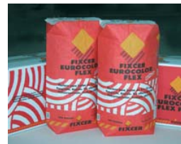
Jointer 4 heures après la pose.