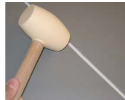
Utiliser un maillet en caoutchouc.