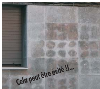
Sans FIXMARMOL , des efflorescences peuvent apparaître.