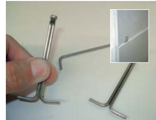
Elegir el millor anclatge.