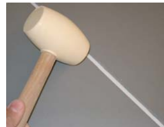
Usar una maça de goma.