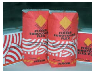
Rejuntar passades 4 hores de la col.locació.