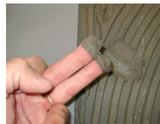
Comprovar que el ciment estigui fresc.