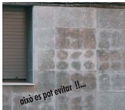
Sense FIXMARMOL poden aparèixer efflorescències.