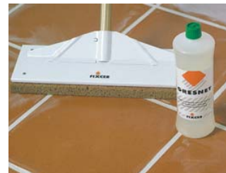
Si nécessaire, nettoyer avec GRESNET .

CONSOMMATIONS : vous connaîtrez la consommation à l'aide de la formule suivante :