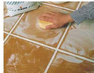
Procéder à un nettoyage à sec.