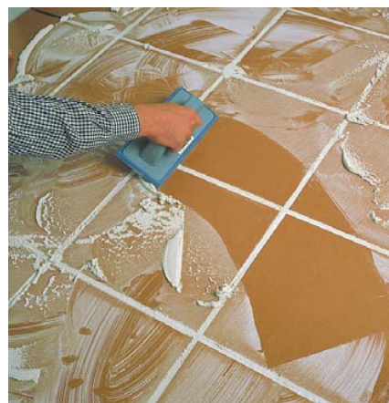
Scellage de joints sur les rebords de piscines.