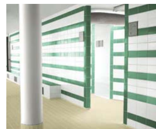
Riempimento economico e duraturo.