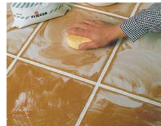
Procedere a una pulizia a secco.