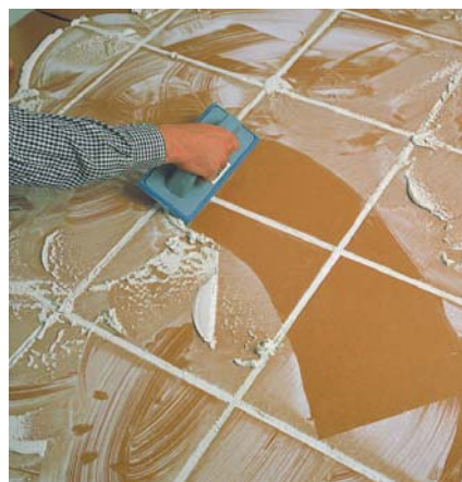
Sigillatura delle giunture nei piazzali delle piscine.