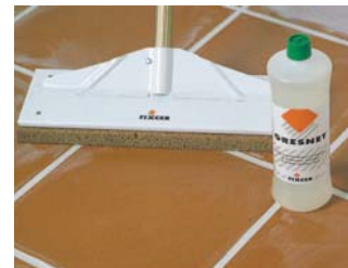
Ove necessario, pulire GRESNET .