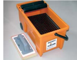
Utiliser le FIX-BUCKET et la FIX-ÉPONGE