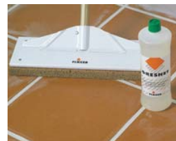
Si nécessaire, nettoyer avec GRESNET .