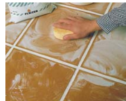
Faire un nettoyage à sec