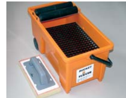
Usar el FIX-BUCKET y la FIX-ESPONJA

Limpieza: ◆ Pasados 30 minutos, limpiar las baldosas con la FIX-ESPONJA o la FIX-LLANA PARA LIMPIAR , ligeramente humedecida con agua. ◆ Si usamos la FIX-ESPONJA , NO debe estar empapada de agua: sólo debe estar humedecida. ◆ Podemos limpiar las herramientas en el cubo especial FIX-BUCKET . ◆ Solamente hacer una única limpieza: si hacemos más, solamente conseguiremos debilitar el color y la resistencia de la junta.