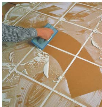
Sellado de juntas de gres residencial.