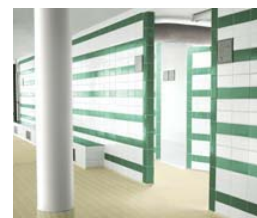
Rejuntado económico y duradero.