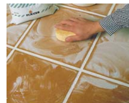
Hacer una limpieza en seco.

Limpieza final: ◆ Al día siguiente, eliminar el velo de color con un paño seco. ◆ No es necesario usar nada más: ni agua, ni estropajo, ... sólo un paño o esponja seca.