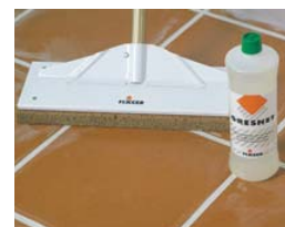
Si es preciso, limpiar con GRESNET .

Limpieza final en baldosas rugosas: ◆ Pasados 7 días del rejuntado, eliminar los residuos con 1 parte del ácido GRESNET y 10 partes de agua.