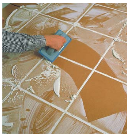
Rejuntat de gres residencial.