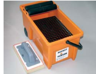
Usar el FIX-BUCKET i la FIX-ESPONJA