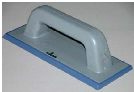
Usar la FIX-ESPÁTULA de goma.