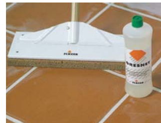
Si és precís, netejar amb GRESNET .