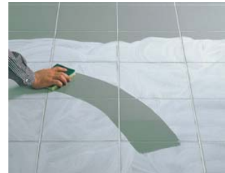
Procéder à un nettoyage à sec.