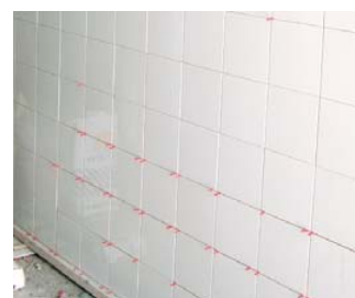
Jointolement économique et durable.