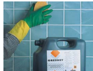
Si nécessaire, nettoyer avec GRESNET .