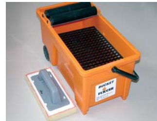
Utiliser le FIX-BUCKET et la FIX-ÉPONGE