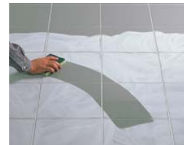
Hacer una limpieza en seco.