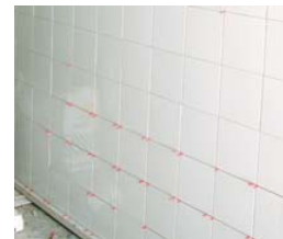
Rejuntado económico y duradero.