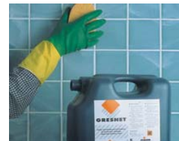
Si es preciso, limpiar con GRESNET .