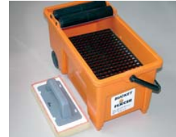
Usar el FIX-BUCKET y la FIX-ESPONJA