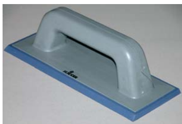
Usar la FIX-ESPÁTULA de goma.