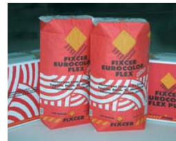
Jointer 90 minutes après la pose.