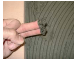
Vérifier que le ciment est frais.