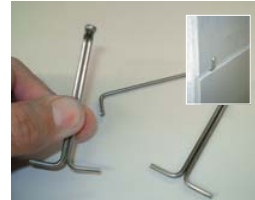
Choisir la meilleure fixation.