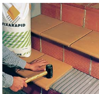
Idéal pour les réformes urgentes.