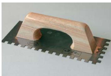
Utiliser une truelle dentée.