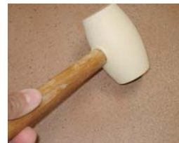
Utiliser un maillet en caoutchouc.