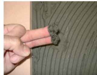
Comprovar que el ciment estigui fresc.