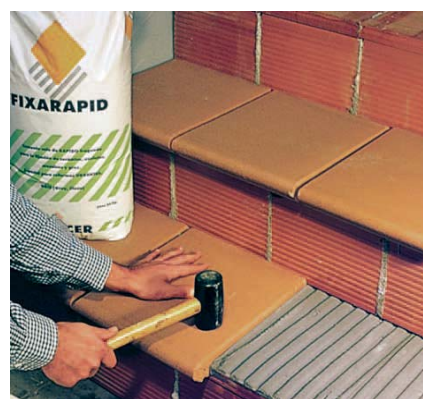
Ideal per reformes urgents.