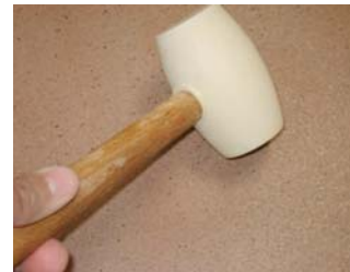
Usar una maça de goma.