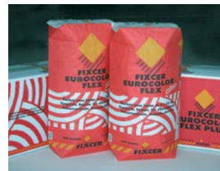
Rejuntar passats 90 minuts des de la col.locació.