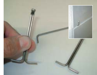
Escollir el millor anclatge.