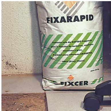
Reparacions urgents en oficines

En les juntes de dilatació aplicar SELLA-LASTIC .