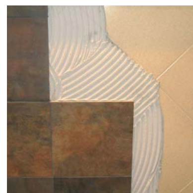
Sobreposicions de gres sobre gres porcel·lànic...

Mesclar amb aigua neta fins homogeneitzar-lo (5,8 litres d'aigua per sac); usar mesclador elèctric lent; deixar 2 minuts de repòs i tornar a mesclar per tenir la pasta preparada per usar-la.