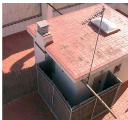
Re-impermeabilitzem respectant l'estètica original.