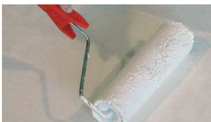
Aplicar amb rodets de pèl curt o rodets de lacar.