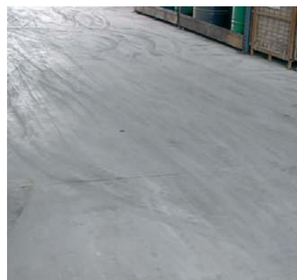
Tambié é un bon tapa-porus en paviments industrials