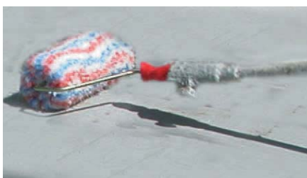
Usar un rodet de pèl llarg.