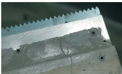
Sur les sols : utiliser une truelle de 3 mm.