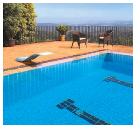
Impermeabilização em terrenos instáveis.