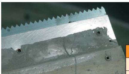
Em pavimentos: utilizar uma talocha de 3 mm.