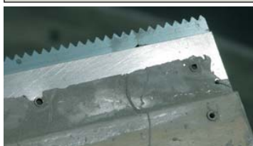
Sur les sols, utiliser une truelle de 3 mm