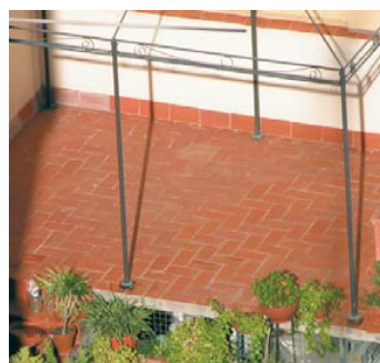
Imperméabilisation des terrasses et des toits.