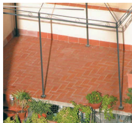
Impermeabilització de terraces i terrats.