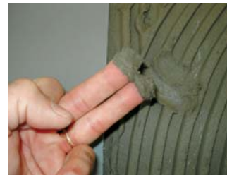
Comprovar que el ciment estigui fresc.