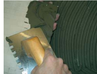
Usar la tècnica del doble encolat.