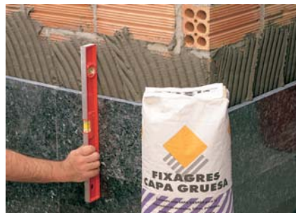
Ideal per enganxar sobre suports irregulars.