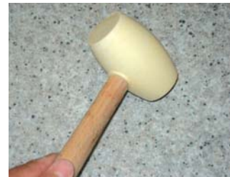
Usar una maça de goma.