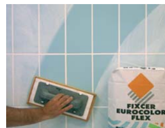
Rejuntar passades 24 hores de la col·locació.