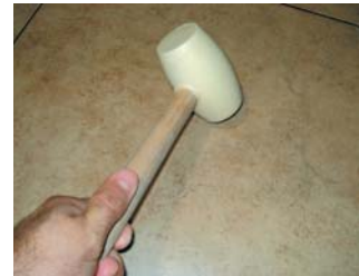
Usar una maça de goma.