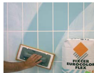
Rejuntar passades 24 hores de la col.locació.