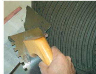
Usar la tècnica del doble encolat.