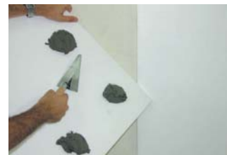
Ideal per enganxar panells aïllants.