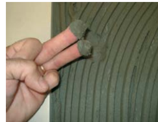
Comprovar que el ciment estigui fresc.