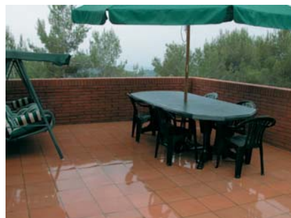
Ideal per terraces exteriors.