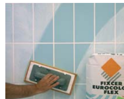
Jointer 24 heures après la pose.