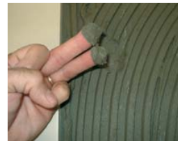
Vérifier que le ciment est frais.