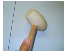
Utiliser un maillet en caoutchouc.