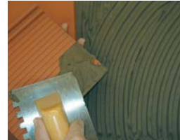
Utiliser la technique du double encollage.