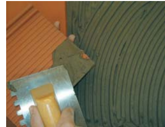
Usar la tècnica del doble encolat.