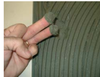
Comprovar que el ciment estigui fresc.