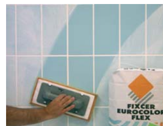
Rejuntar passades 24 hores de la col.locació.