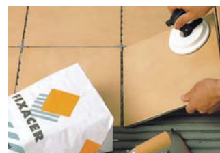
Usar eines adequades.