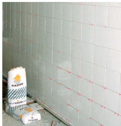
Per enganxar rajols en interiors.