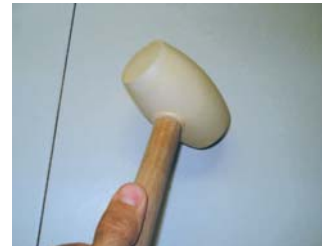
Usar una maça de goma.