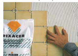
Pour coller sur le plâtre ou placoplâtre.