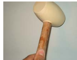
Utiliser un maillet en caoutchouc.