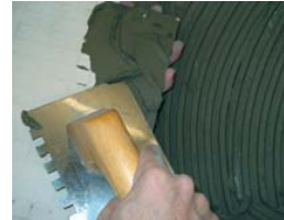
Utiliser la technique du double encollage.