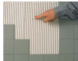
Vérifier que le ciment est frais.