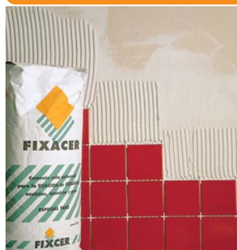
Idéal pour coller des carreaux de faïence sur des enduits en plâtre.