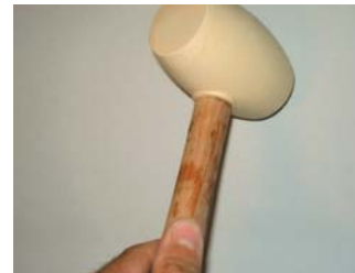
Usar una maça de goma.