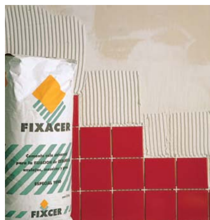
Ideal per enganxar rajols sobre lliscats de guix.