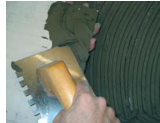
Usar la tècnica del doble encolat.