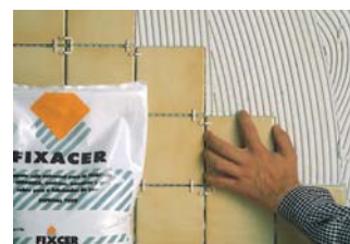
Per enganxar sobre guix o cartró-guix.