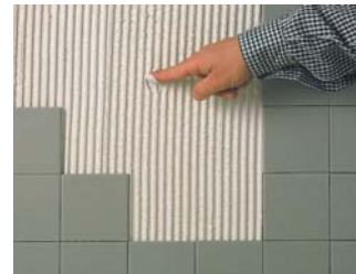
Comprovar que el ciment estigui fresc.