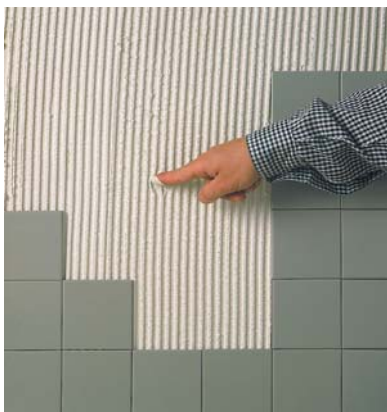
Ciment encara humit: correcte.