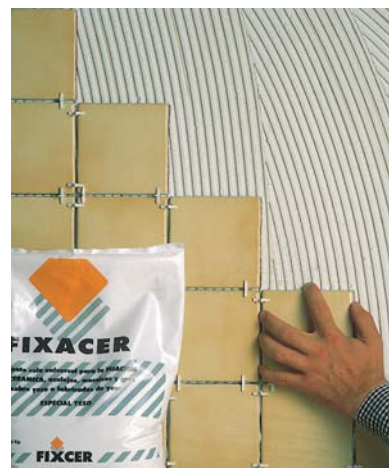
Colocación sobre revoques de yeso.

FIXACER especial guix és un ciment-cola formulat amb ciment, àrids seleccionats i additius específics que, mesclats amb aigua, donen un ciment de fàcil treballabilitat amb la llana de dents, i permet enganxar de forma molt segura qualsevol tipus de rajola de València i gres sobre guix o panels de guix.