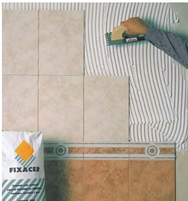
Col·locació sobre arrebossats d'escaiola.

Recomanem usar un material específic com el FIXCOLOR (grà fi o gruixut), o EUROCOLOR FLEX o EUROCOLOR FLEX PLUS o JUNTATEC o CERPOXI . En les juntes de dilatació aplicar SELLA-LASTIC .