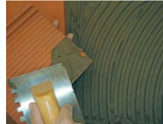
Usar la tècnica del doble encolat.