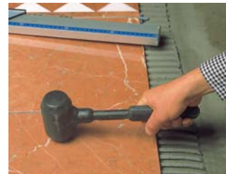
Usar una maça de goma.