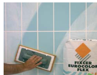
Rejuntar passades 24 hores de la col.locació.