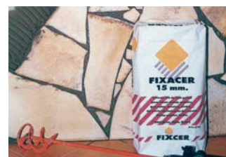
Ideal per enganxar pedres irregulars.