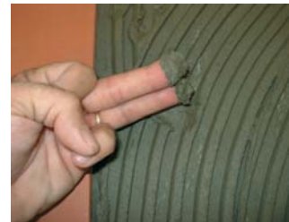
Comprovar que el ciment estigui fresc.