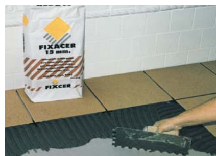
Ideal per enganxar rajols i gres sobre superfícies irregulars.