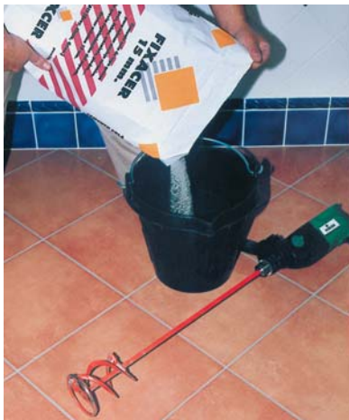
Mesclar amb trepant elèctric.

Es subministra en: Sacs de 25 Kg. en colors Gris