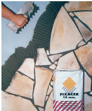
Col.locació de pedra natural amb FIXCER 15 mm