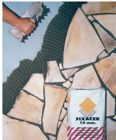
Colocación de piedra natural con FIXCER 15mm.