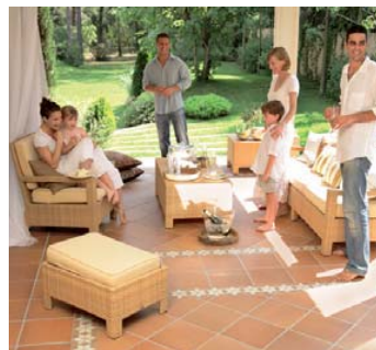
Avec FIX-OIL , vous éviterez de tacher votre sol.