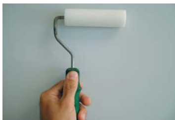
Pour appliquer FIX-OIL , utiliser un rouleau à laquer.