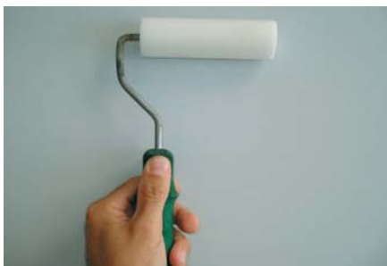
Per aplicar FIX-OIL usar un rodet de lacar.